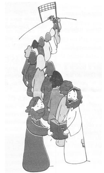
Los últimos serán los primeros y los primeros los últimos

Una de las tareas más importantes en una comunidad cristiana será siempre ahondar cada vez más en la experiencia de Dios vivida por Jesús. Solo los testigos de ese Dios pondrán una esperanza diferente en el mundo.